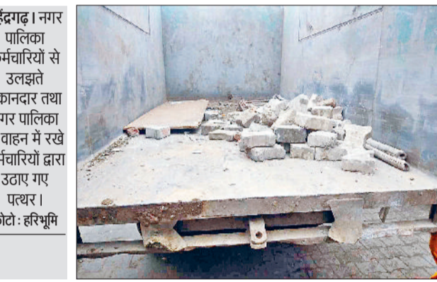
कॉम्प्लैक्स का अतिक्रमण हटाने का कागजों तक प्लान

आखिरकार शहर को कब मिलेगी अतिक्रमण से मुक्ति बाजार में दुकानदारों की ओर से किए अतिक्रमण की वजह से बाजार में आने वाले ग्राहकों को काफी परेशानी होती है। शॉपिंग कॉम्प्लेक्स के जिन दुकानदारों ने दुकान के बाहर आम रास्ते या रोड पर अतिक्रमण किया हुआ है। अतिक्रमण से आमजन को भारी परेशानी का सामना करना पड़ता है। प्रतिदिन बाजार में रोड जाम की स्थिति बनी रहती है। शहर में सबसे ज्यादा अतिक्रमण 11 हट्टा बाजार, शॉपिंग कॉम्प्लेक्स, सिनेमा रोड, गांधी मार्केट, आईटीआई रोड, रेलवे रोड सहित अनेक जगहों पर दुकानदारों ने पक्का अतिक्रमण किया हुआ है।