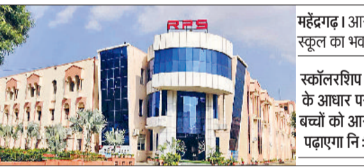
महेन्द्रगढ़। आरपीएस स्कूल का भवन।