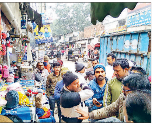
महेन्द्रगढ़। नगर पालिका कर्मचारियों से उलझते दुकानदार तथा नगर पालिका के वाहन में रखे कर्मचारियों द्वारा उठाए गए पत्थर।

नगर पालिका की ओर से शहर में अतिक्रमण हटाने के लिए चलाए जाने वाला अभियान महज खानापूर्ति तक सीमित रह गया है। नगर पालिका शहर में अक्सर जोश के साथ अतिक्रमण हटाने के लिए पूरे जोश के साथ मैदान में उतरती है, लेकिन बाजार में उतरने के बाद खानापूर्ति करके वापस कार्यालय लौट जाती है। शुक्रवार को भी कुछ ऐसा ही देखा को मिला। नगर पालिका की टीम करीब एक घंटे तक बाजार में रही। इस दौरान की टीम की ओर से न तो किसी अतिक्रमणकारी का चालान किया और न ही किसी अतिक्रमणकारी का सामान जप्त किया। केवल दुकानदारों की ओर बाजार में अतिक्रमण करने को लेकर लगाई गई ईट और पत्थर लेकर कर्मचारी