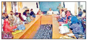
महेन्द्रगढ़। कार्यक्रम में संबोधित करते हुए।