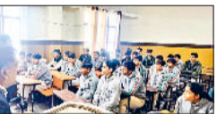
नारनौल। सेमिनार में विद्यार्थियों को संबोधित करते हुए।