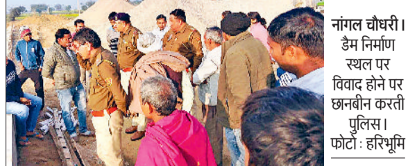
नांगल चौधरी। डैम निर्माण स्थल पर विवाद होने पर छानबीन करती पुलिस।

निर्माण शुरू करवाने से पहले ठेकेदार ने करवाई थी वीडियो ग्राफी 8-10 झाड़ीनूमा पैड़ों का नुकसान हुआ, फॉरेस्ट विभाग ने काट दिया चालान