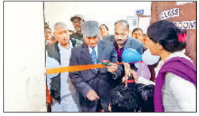
महेन्द्रगढ़। डिजिटल क्लास रूम का शुभारंभ करते अतिथि।