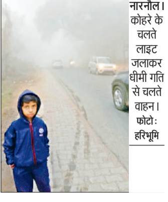
नारनौल। कोहरे के चलते लाइट जलाकर धीमी गति से चलते वाहन।

चलते सड़क पर वाहन धीमी गति से लाइट जलाकर चलने को मजबूर हो रहे हैं। बता दें कि इस सीजन में 27 दिसंबर रात से घने कोहरे ने दस्तक दी थी, जिसके बाद से लगातार सुबह देर तक व रात को घना कोहरा छाया रहता है। जिससे एक तरफ जहां आमजन को परेशानी हो रही है, वहीं दूसरी ओर कोहरा व आंस के रूप में गिर रही बूंद फसलों के लिए काफी लाभदायक साबित होगी। बता दें कि पिछले दो-तीन दिन से सघन कोहरा की सफेद चादर ने सम्पूर्ण इलाके को अपने आगोश में ले रखा है। जिसकी वजह से वाहनों की रफ्तार पर ब्रेक